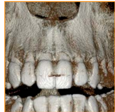
>> 3D Diagnostik FOV 5 x 5 cm